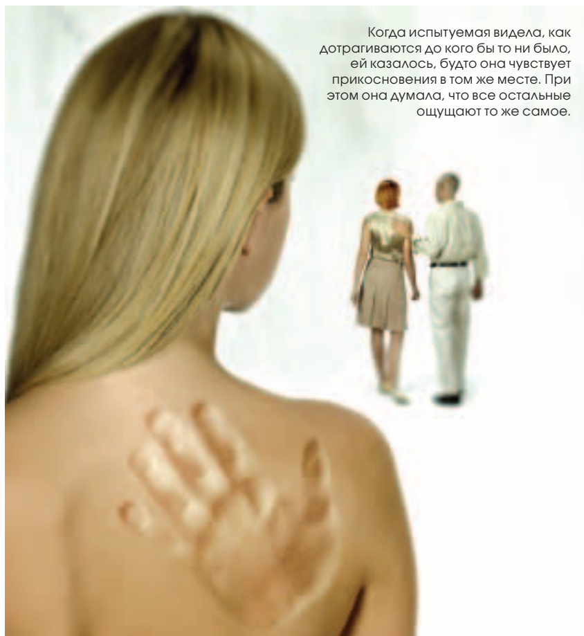
Когда испытуемая видела, как дотрагиваются до кого бы то ни было, ей казалось, будто она чувствует прикосновения в том же месте. При этом она думала, что все остальные ощущают то же самое.

Затем исследователи сравнили паттерн активности мозга, вызываемый каждым из типов вопросов. Оказалось, что, когда речь шла о са-